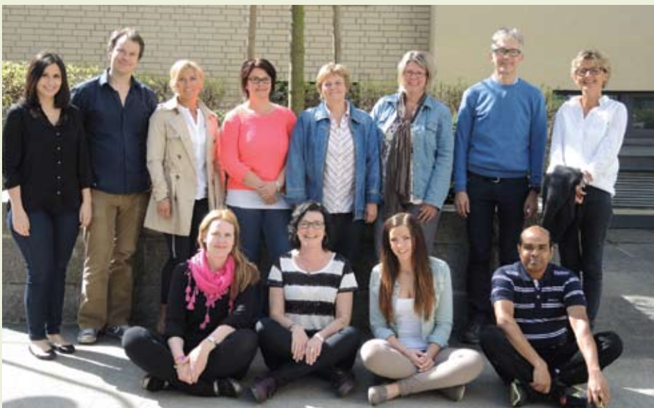
Bilde fra prosjektets vårsamling

TUSEN TAKK FOR INNSATSEN! VI ØNSKER DERE EN HERLIG SOMMER!